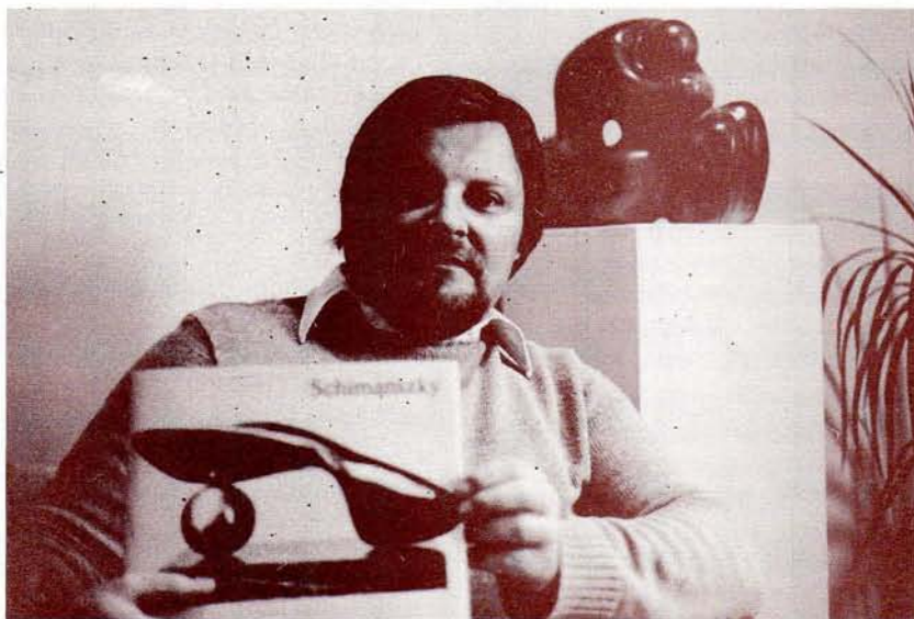
Léo Schimanzsky et son livre. À l'arrière plan, une de ses dernières sculptures de marbre vert «The Thinker».

En octobre dernier, la Galerie Alexandre de Montréal lançait un album sur l'œuvre du sculpteur québécois Léo Schimanzsky. L'album comprend une soixantaine de reproductions noir et blanc de sculptures et de dessins de l'artiste. Il est complété par des photos représentant des scènes d'atelier. La préface et les textes d'accompagnement sont signés par notre collaboratrice Ninon Gauthier.