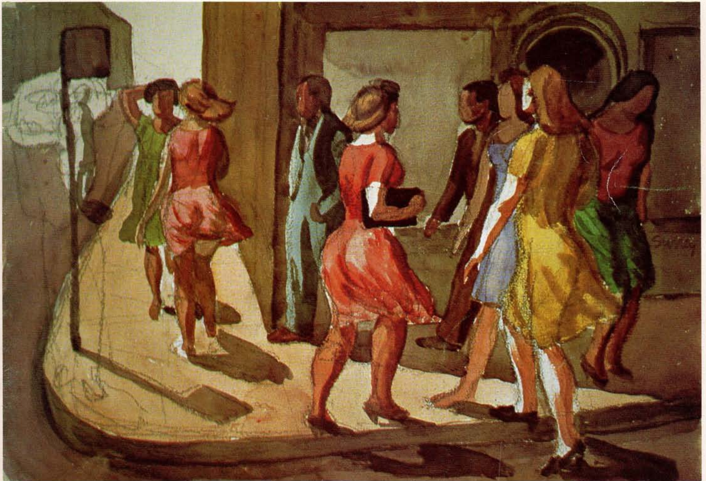
Philip Surrey: «La danse de la rue», 1950.